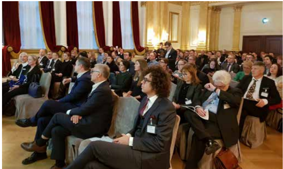
Visiona Venäjä keräsi Peilialin täyteen.

Ei ole olemassa mitään valmista mallia, vaan jokaisella toimialalla, yhtiöllä ja projektilla on oma tarinansa. Hyvään suunnitteluun ja valmisteluun kannattaa panostaa. Venäjän markkinoilla tarvitaan jatkossakin sitkeyttä ja pelisilmää.